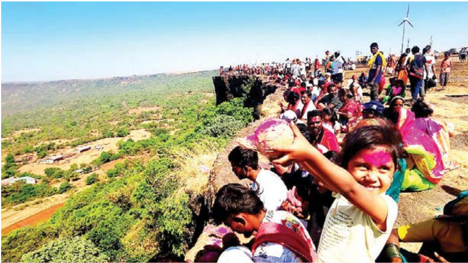
निसर्गपूजा उत्साहात : जयाद्री ते सह्याद्री हा पश्चिम पाटण खोऱ्यातील निवकणे जानाई देवी जेजुरी ते निवकणे हे सुमारे दीडशे किलोमीटर अंतर पार करून, जानाईदेवी पालखी सोहळा गुरुवारी पहाटे काऊदरा सडावाघापुर येथे पोहचला, जानाई भक्त निसर्गपुजाकांच्या हस्ते वसुंधरा जानाई देवीला नारळ-बिया अर्पित करीत उत्तम पाऊस पाडाय

महाळुंगे : चाकण औद्योगिक भागात महाळुंगे जवळ द्वाका स्कूल ते वाय जंक्शन या रस्त्याने जाणाऱ्या अकरा वर्षीय मुलीला एका ३० ते ३५ वर्षे वयोगटातील नराधमाने लगतच्या टेकडीवर नेऊन अत्यांत आक्षेपाई वर्तन केले. सदरची घटना बुधवारी रात्री साडेदहाच्या दरम्यान घडली. याप्रकरणी संबंधित अकरा वर्षीय मुलीच्या आईने महाळुंगे एमआयडीसी पोलीस ठाण्यात तक्रार दिली आहे. त्यावरून तीस ते पस्तीस वर्षे वयोगटातील अंगात काल बाघांचा शर्ट व ब्लू जीन्स परिधान केलेल्या व्यक्तीवर गुन्हा दाखल करण्यात आला आहे. संबंधित तरुण हिंदी भाषिक असल्याची प्राथमिक माहिती समोर आली आहे. याबाबत अधिक तपास महाळुंगे एमआयडीसी पोलीस करत आहेत.