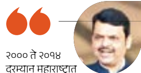
— देवेंद्र फडणवीस, मुख्यमंत्री

ही नवी शहरे मुंबईच्या तुलनेत तीनपट मोठी असतील आणि उद्योगांसाठी उत्तम संधी उपलब्ध करतील, असेही त्यांनी सांगितले. तसेच नदीजोड प्रकल्पामुळे विदर्भ आणि मराठवाड्यातील दुष्काळग्रस्त भागांना कायमस्वरूपी पाणीपुरवठा करण्यासाठी चैनगंगा-नळगंगा आणि गोदावरी जलप्रकल्प हाती घेतले जात आहेत. या प्रकल्पांमुळे हजारो शेतक-यांना फायदा होईल आणि शेती उत्पादन वाढणार असल्याचे प्रतिपादन मुख्यमंत्री फडणवीस यांनी केले.