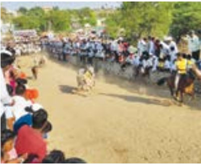
पिंपरी तालुका शिरूर येथील महाशिवरात्री यात्रेनिमित्त आयोजित बैलगाडा शर्यतीतील चित्त थराक क्षण