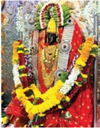
वेल्हे तालुक्यातील शिरकोली येथील सुप्रसिद्ध शिरकाई देवीच्या अत्यंत प्रसन्न व मंगलमय रूप