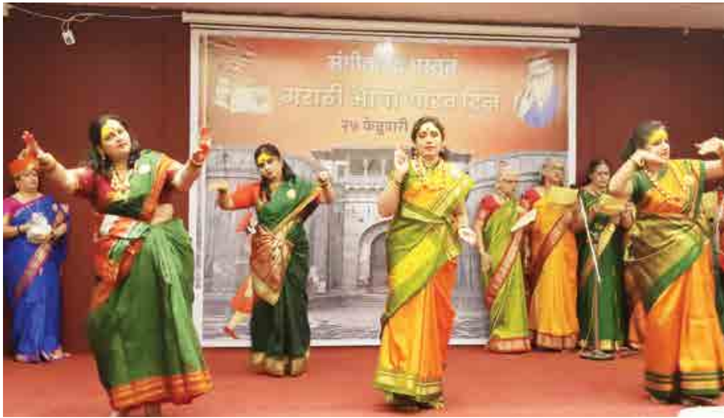
पुणे संगीत क्षेत्रात महत्त्वपूर्ण कार्य करणाऱ्या संगीतानंद संस्थेतर्फे आज आयोजित मराठी भाषा गौरव दिन या संगीतमय कार्यक्रमात लोककलाचे सादरीकरण करून संगीतमय शोभायात्रेद्वारे मराठीचा जागर करण्यात आला.