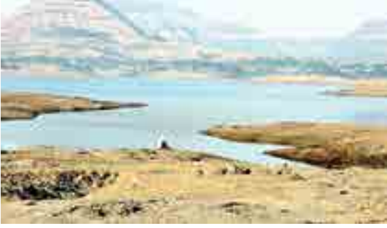
माणिकडोह धरणातील पाण्याचा साठा अत्यल्प.

नारायणगाव : कुकडी प्रकल्पाच्या माणिकडोह धरणामध्ये पाण्याचा साठा अवघा २८.१७ टक्के इतका अत्यल्प शिल्लक राहिल्याने उन्हाळ्यामध्ये परिसरातील शेतकऱ्यांना शेतीसाठी तर सोडाच परंतु पिण्यासाठी देखील पाणी शिल्लक राहिल की नाही अशी भीती व्यक्त होत आहे. माणिकडोह धरणासाठी परिसरातील शेतकऱ्यांच्या मोठ्या प्रमाणात जमिनी गेल्या परंतु दरवर्षी या शेतकऱ्यांना शेतीसाठी उन्हाळ्यात पाणी उरलख्य होत नाही, त्यामुळे शेतकऱ्यांची मोठ्या प्रमाणात कुचंबणा होत आहे. सध्या कुकडी प्रकल्पांमधून पूर्व भागातील तालुक्यांसाठी पाण्याचे आवर्तन सुरू आहे. तसेच माणिकडोह धरणामधून