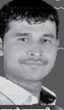
हाच तो बलात्कारी

कुटुंबियांसह नातेवाईकांनाही पोलीसांचा 'सांगावा'