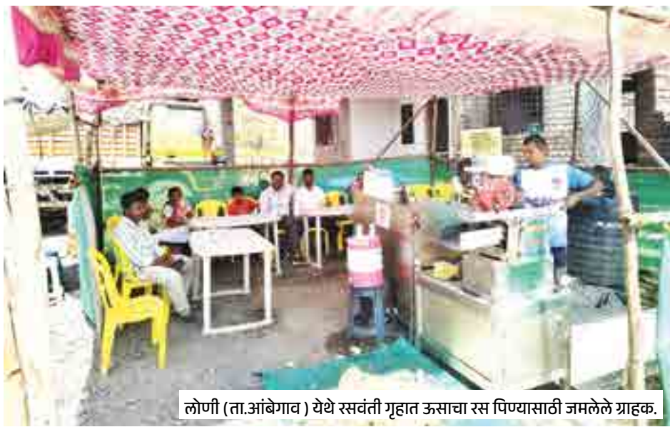
लोणी (ता.अंबेगाव) येथे रसवंती गृहात ऊसाचा रस पिण्यासाठी जमलेले ग्राहक.

लोण-धामणी : उन्हाळ्याची चाहूल लागताच ग्रामीण भागात ठिकठिकाणी रसवंतीची दुकाने सुरू झाली आहेत. उन्हापासून दिलासा मिळण्यासाठी नागरिकांनी उसाच्या रसाला पसंती दिली आहे. फेब्रुवारीच्या पहिल्या आठवड्यापासूनच उन्हाची तीव्रता मोठ्या प्रमाणात जाणवू लागली आहे. उन्हाळा आला की रसवंती नजरेस पडतात. यंदा देखील शहरांसह ग्रामीण भागात मुख्य रस्त्यांवर उसाच्या रसाची दुकाने थाटली गेली आहेत. उन्हाची वाहकता व आरोग्यासाठी चांगला असल्याने रसवंतीवर नागरिकांची गर्दी होत आहे. मागील काही दिवसांपासून थंडीने काढता पाय घेतल्याने उन्हाचे चटके वाढू लागले आहेत. दिवसा उकाडा तर रात्री थंडी असे सध्याचे वातावरण आहे. तापमानाची वाटचाल ३१ ते ३२ अंश सेल्सिअसकडे सुरू झाली आहे. उन्हाची वाहकता वाढल्याने, लोकांचा काळ उसाच्या रसाकडे वाढल्याचे चित्र आहे.