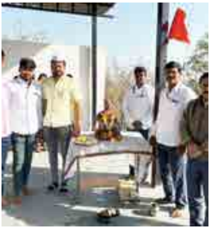
ढोकसांगवी, ता.शिरूर येथे शिवजयंती साजरी करण्यात आली.