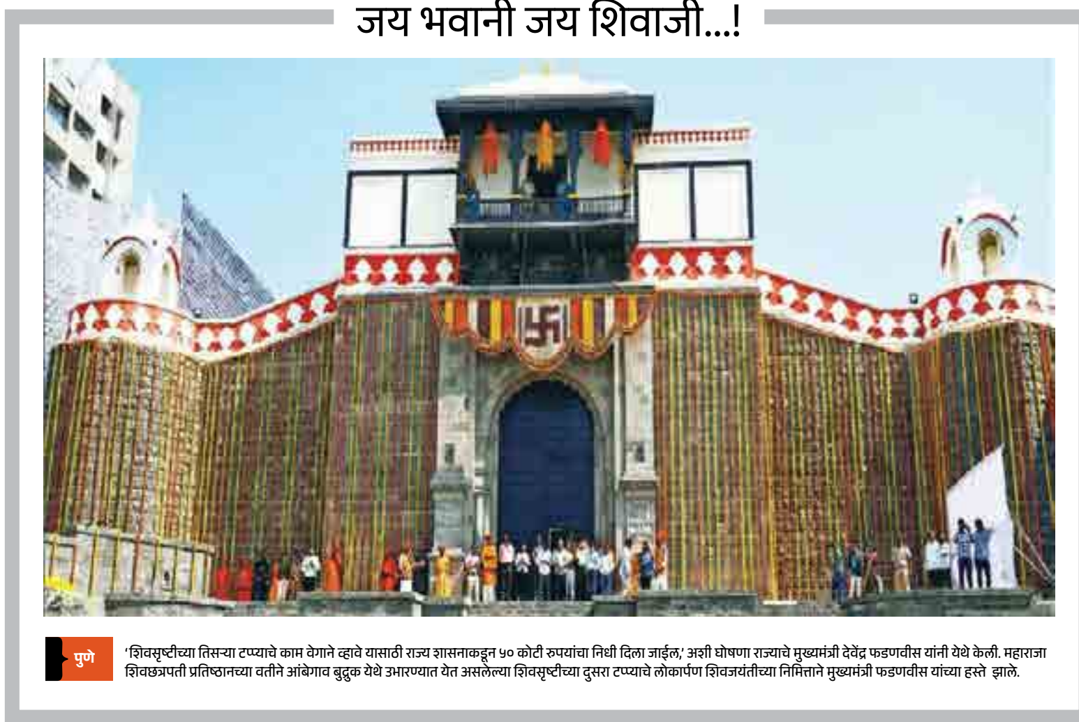
पुणे 'शिवसृष्टीच्या तिसऱ्या टप्प्याचे काम वेगाने व्हावे यासाठी राज्य शासनाकडून ५० कोटी रुपयांचा निधी दिला जाईल,' अशी घोषणा राज्याचे मुख्यमंत्री देवेंद्र फडणवीस यांनी येथे केली. महाराजा शिवछत्रपती प्रतिष्ठानच्या वतीने आंबेगार बुद्रुक येथे उभारण्यात येत असलेल्या शिवसृष्टीच्या दुसऱ्या टप्प्याचे लोकार्पण शिवजयंतीच्या निमित्ताने मुख्यमंत्री फडणवीस यांच्या हस्ते झाले.

पुणे : पुणे शहरात मागील काही दिवसांपासून चोरीच्या घटनांमध्ये वाढ होताना दिसत आहे. दिवसाढवळ्या घरफोड्या, चेन स्नॅचिंग, रस्त्यात अडवून लुटणे अशा घटना सातत्याने घडतायेत. अशातच चोरांनी चोरी करण्याचा मोठा पराक्रम केलाय. चोरट्यांनी पाकिंगमध्ये उभ्या केलेल्या तीन रिक्षांची चाकेच चोरून नेली आहेत. अशा महान चोरांचं काय करावं असा सवाल उपस्थित होऊ लागला आहे. मार्केटवर्ड भागातील विचित्र प्रकारची चोरी पाहून रिक्षाचालकांनी डोक्याला हातच लावला. हे चोर चाके घेऊन पुढे त्यांचं काय करणार? असा सवाल चालकांनी उपस्थित केला आहे. पोलीस तरी त्या चोरांना पकडून काय करणार? अशी प्रतिक्रिया चालकांनी दिली आहे. पुण्यातील मार्केटवर्ड मधून हा चोरीचा प्रकार उघडकीस आला आहे. चोरट्यांनी पाकिंगमध्ये उभा केलेल्या तीन रिक्षांची चाके चोरून नेली. रात्रीच्या वेळी ही घटना घडल्याचे समोर आले आहे.