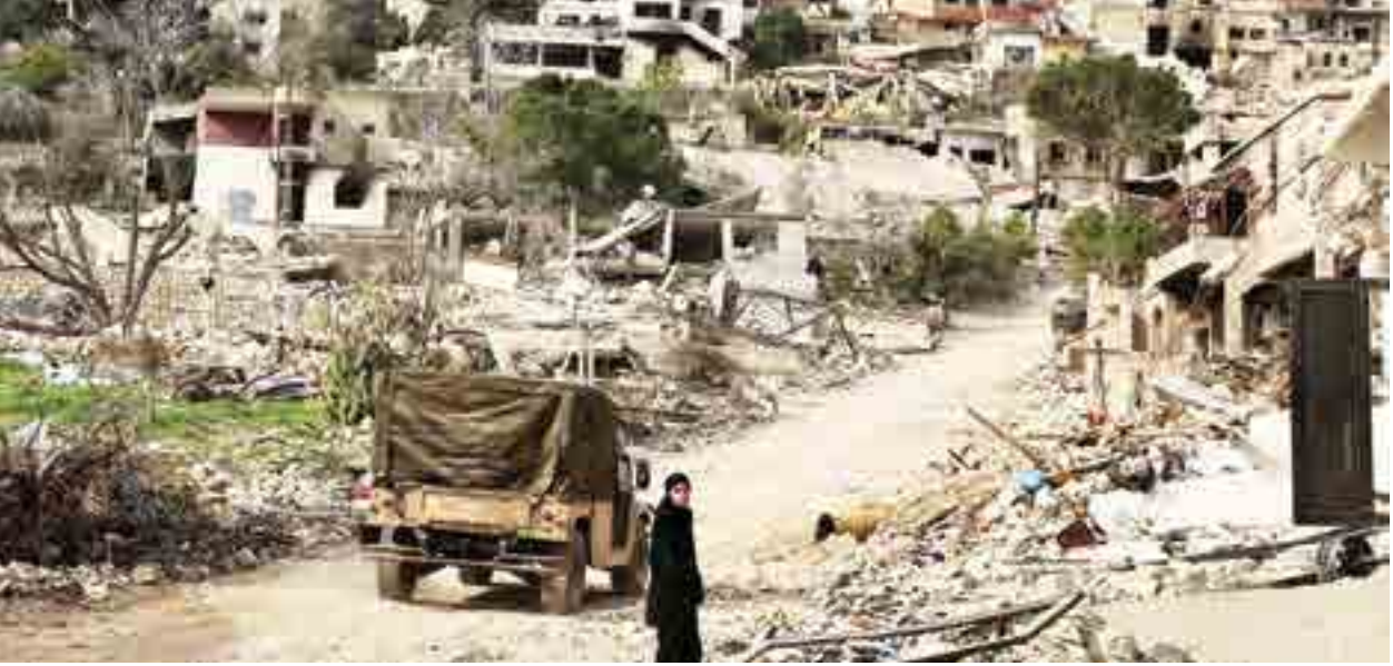
लेबनॉन उद्ध्वस्त लेबनॉन : लेबनॉनमधील कफर किला या दक्षिण लेबनॉनमधील गावातून, इस्रायली सैन्याने माघार घेतली असली, तरी या भागाचे इस्रायलने केलेल्या मान्यात मोठे नुकसान झाले आहे.

केले ५.४४ कोटीचे कोकेन - गुप्तचर माहितीच्या आधारे, महसूल गुप्तचर संचालनालय (डीआरआय) मुंबईने बुधवारी मुंबई विमानतळावरून भारतात अंमली पदार्थाची तस्करी करण्याचा प्रयत्न करणाऱ्या काँग्रेसच्या महिला नागरिकाला आरोपीला एनडीपीएस कायद्याअंतर्गत अटक केली होती. आरोपीला दंडाधिकार्यांसमोर हजर करण्यात आल्यानंतर आदेशानुसार जवळच्या सरकारी रुग्णालयात दाखल करण्यात आले, असे अधिकाऱ्यांनी सांगितले. प्रवाशाकडील ५४४ ग्रॅम कोकेन असलेले १० कॅम्पूल्स जप्त करण्यात आले. त्याची बाजारात ५.४४ कोटी रुपये किंमत आहे.