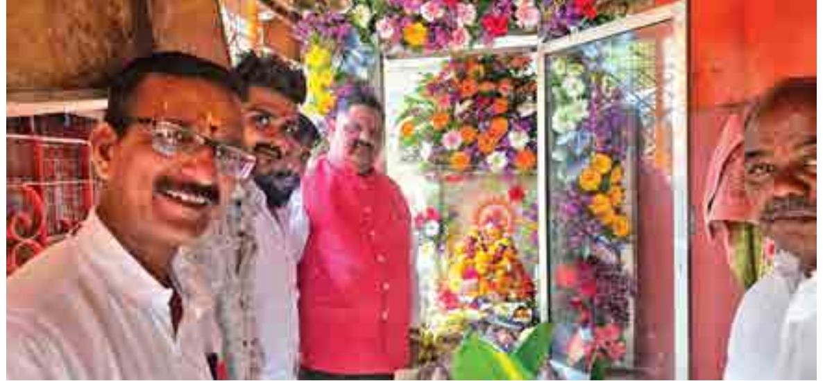
पुणे गण गण गणात बोते। श्री संत गजानन महाराज यांचा प्रगटदिन सोहळा आज शहरामध्ये मोठ्या उत्साहात आणि भक्तीभावाने साजरा करण्यात आला, भोसलेनगर येथील श्री गजानन महाराजांच्या मंदिरात आज सकाळपासूनच भाविकांनी दर्शनासाठी मोठ्या प्रमाणावर गर्दी केली होती. यानिमित्त मंदिरात अनेक धार्मिक कार्यक्रमांचे आयोजन करण्यात आले होते.

रेल्वे स्थानकावरून प्रवास करताना निर्धारित वेळेनुसार येणारी गाडी कोणत्या 'प्लॅटफॉर्म'वर येणार आहे, याची कल्पना आता रेल्वे प्रवाशांना एक तास अगोदर समजणार आहे. मध्य रेल्वे विभागाच्या पुणे रेल्वे प्रशासनाने अचानक गर्दी होऊन चेग्राचेगरीसारखी दुर्घटना होऊ नये, प्रवाशांची धावपळ होऊ नये, म्हणून व्यवस्थापनासाठी निर्णय घेण्यात आला आहे.यापूर्वी अर्धा तासापर्यंत किंवा पंधरा मिनिटे अगोदर अथवा अचानक स्थानक बदलण्यात आल्याची माहिती देण्यात येत होती. पुणे रेल्वे स्थानकावर सहा 'प्लॅटफॉर्म' आहेत. दिवसभरातून एक्सप्रेस, लोकल डेम्, पॅसेंजर अशा २०० गाड्या येथून धावतात.