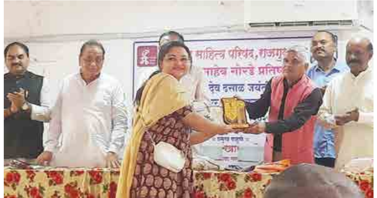
राजगुरुनगर येथे नामदेव ढसाळ जयंती निमित्त साहित्यिकांचा सन्मान करताना मान्यवर.