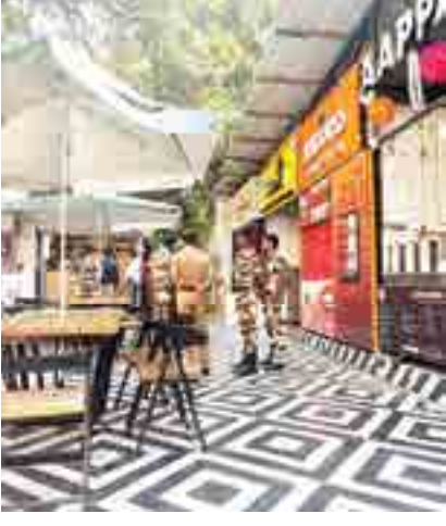
नळ स्टॉप मधील एसएनडीटी कॉलेजच्या समोरील बस स्टॉप जवळ अनधिकृत फूड मॉल उभारण्यात आला होता. त्याच्यावर आज अतिक्रमण विभागाने कारवाई केली.