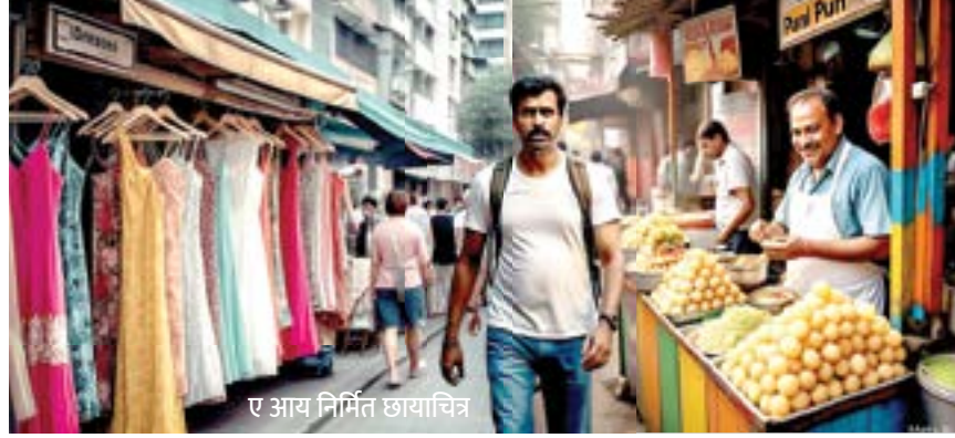
ए आय निर्मित छायाचित्र