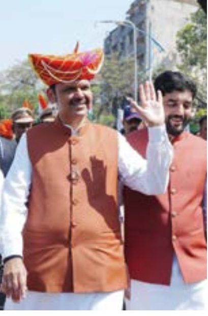
छत्रपती शिवाजी महाराज यांच्या जयंतीनिमित्त 'जय शिवाजी-जय भारत' या पदयात्रेत मुख्यमंत्री देवेंद्र फडणवीस यांच्यासह केंद्रीय मंत्री मुरलीधर मोहोळ सहभागी झाले.