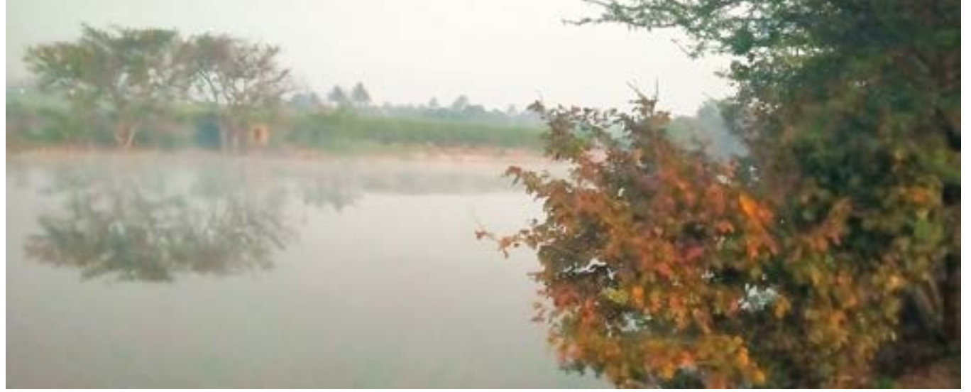
वळती (ता. आंबेगाव) येथील मीना नदीच्या पात्रात सकाळच्या वेळी निघत असलेल्या वाफा.

रांजणी : आंबेगाव तालुक्याच्या पूर्व भागात गेली पंधरा दिवसांपासून उन्हाचा कडाका अतिशय वाढला आहे. दिवसभर कडाक्याचे ऊन व तर रात्री व पहाटे कडाक्याची थंडी सध्या पडत आहे. सध्याच्या उन्हाळ्याच्या दिवसातही घोंड व मीना नद्यांच्या पात्रातून सकाळच्या प्रहारी वाफा निघत असल्याचे चित्र सध्या दिसत आहे. यामुळे नागरिक बेजार झाले आहेत. यंदा उन्हाळ्याची चाहूल सर्वत्र लवकरच सुरू झाली. गेल्या पंधरा दिवसांपासून उन्हाचा कडाका अतिशय वाढला आहे.सकाळी अकरा वाजल्यापासूनच प्रखर ऊन पडते. सायंकाळी पाच वाजेपर्यंत ऊन जाणवते. त्यानंतर रात्री सात नंतर थंड हवा सुरू होते. रात्रीच्या वेळी कडाक्याची थंडी पडते. पहाटे थंडीचा कडाका आधिक वाढतो.सकाळपर्यंत थंडी जाणवते. त्यामुळे नागरी व्रत झाले आहेत. दिवसा कडक उन्हाणे, तर रात्री कडाक्याच्या थंडीने नागरिक बेजार झाले आहेत.