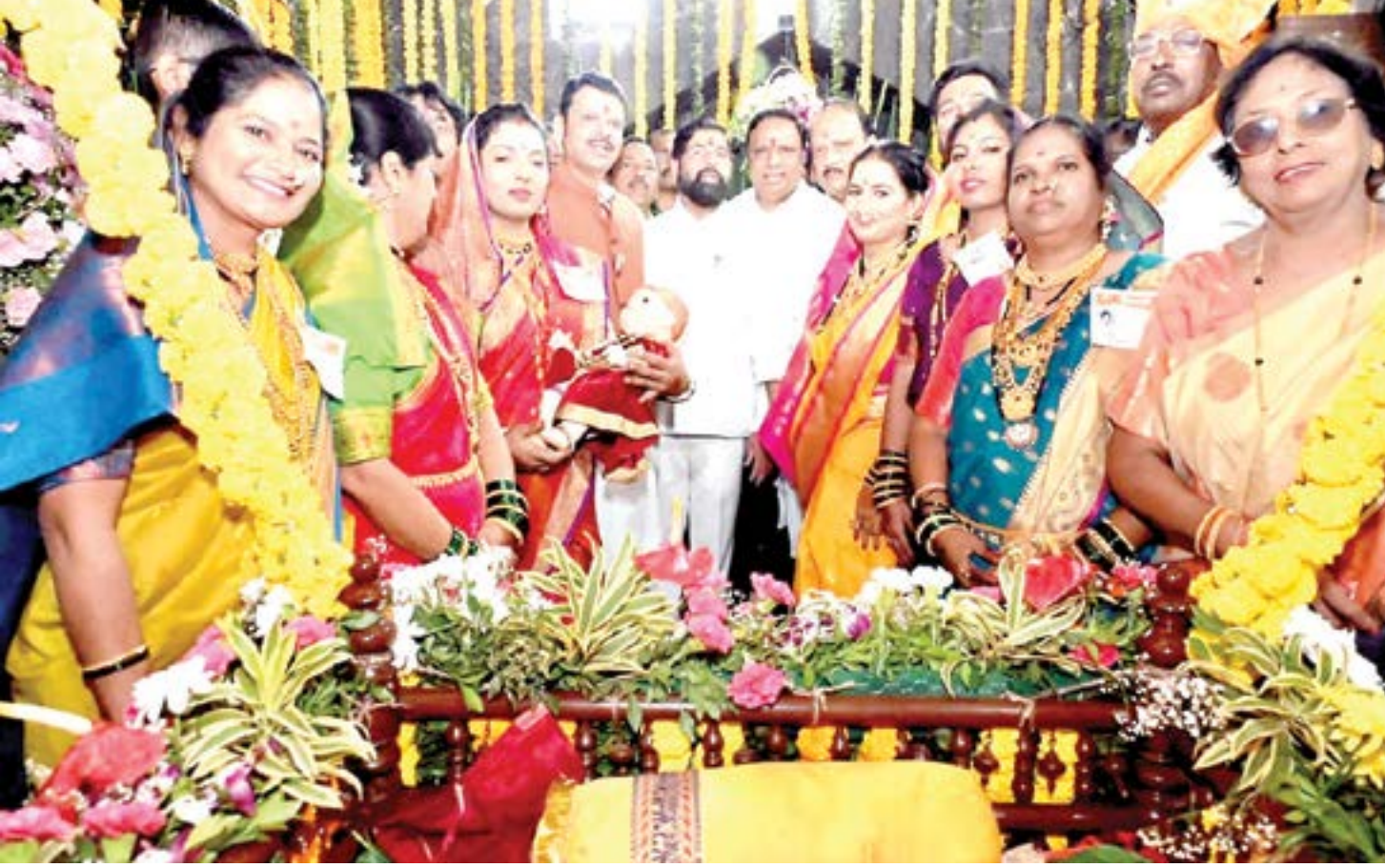
शिवजयंती उत्साहात: छत्रपती शिवाजी महाराज यांची जयंती किल्ले शिवनेरीवर उत्साहात साजरी करण्यात आली. मुख्यमंत्री देवेंद्र फडणवीस, उपमुख्यमंत्री एकनाथ शिंदे आणि अजित पवार यांच्यासह अनेक मान्यवर यावेळी गडावर उपस्थित होते.