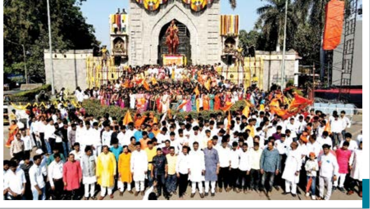
राष्ट्रसंचार छायाचित्र सेवा