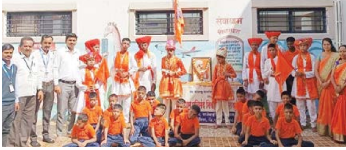
पिंपळे जगताप ता. शिरूर येथील सेवाधाम मतिमंद निवासी विद्यालयात विशेष विद्यार्थ्यांनी साजरी केलेली शिवजयंती.