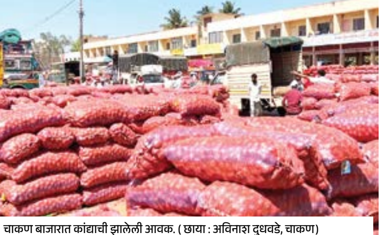
चाकण बाजारात कांदाची झालेली आवक.

चाकण : खेड कृषी उत्पन्न बाजार समितीच्या चाकण येथील महात्मा फुले मार्केट्याई मध्ये कांदा, बटाटा व टोमॅटोची मोठी आवक झाली. भुईमूग शेंगा व लसणाच्या भावात मोठी वाढ झाली. तसेच पालेभाज्यांची भरपूर आवक झाल्याने पालेभाज्यांच्या दरात घसरण झाली. एकूण उलाढाल ६ कोटी, ९० लाख रुपये झाली. चाकण येथील बाजारात कांदाची एकूण आवक ८,००० क्विंटल झाली. गेल्या आठवड्याच्या तुलनेत ही आवक ३,५०० क्विंटलने वाढून भावात ५०० रुपयांची उच्चांकी वाढ झाली. कांदाचा कमाल भाव ३,००० रुपयांवरून ३ हजार ५०० रुपयांवर पोहोचला. बटाटाची एकूण आवक १,६०० क्विंटल झाली. गेल्या आठवड्याच्या तुलनेत ही आवक १०० क्विंटलने वाढली मात्र भाव स्थिर राहिले. लसणाची एकूण आवक २५ क्विंटल झाली. गेल्या आठवड्याच्या तुलनेत ही आवक स्थिर राहून भावात एक हजार रुपयांची मोठी वाढ झाली. हिरव्या मिरचीची एकूण आवक ३२० क्विंटल झाली. हिरव्या मिरचीला ३ हजार रुपयांपासून ते ५ हजार ५०० रुपयांपर्यंत भाव मिळाला. ओल्या भुईमूग शेंगांची एकूण आवक ३ क्विंटल झाली असून, या शेंगांना १० हजार रुपयांपर्यंत कमाल भाव मिळाला.