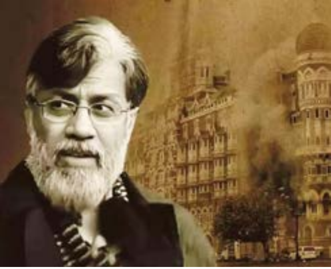
होता. या हल्ल्यात १६६ जणांचा मृत्यू झाला होता.

नवी दिल्ली : अमेरिकेचे राष्ट्राध्यक्ष डोनाल्ड ट्रम्प यांच्या घोषणेनंतर दुसऱ्याच दिवशी भारताच्या सुरक्षा यंत्रणा २६/११ च्या मुंबई दहशतवादी हल्ल्यात सहभागी असलेल्या तहव्वूर राणाला भारतात आणण्याच्या तयारीत आहेत. सूत्रांनी दिलेल्या माहितीनुसार, राष्ट्रीय तपास यंत्रणेच्या (एनआयए) पथकाला सज्ज राहण्यास सांगण्यात आले आहे. राणाला आणण्यासाठी ही टीम केव्हाही अमेरिकेत जाऊ शकते. या प्रक्रियेसाठी भारत सरकारने अमेरिकी प्रशासनाकडे कागदपत्रे सुपूर्द केली आहेत. 'सरेंडर वॉरंट' जारी करण्याची प्रक्रिया सुरू करण्यात आल्याचे अमेरिकेच्या परराष्ट्र मंत्रालयाने म्हटले आहे.