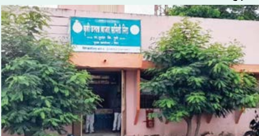
बाजार समितीचा सभापती आणि उपसभापती कोण होणार, याकडे पुरंदर आणि बारामती येथील शेतकऱ्यांचे लक्ष लागले आहे. नीरा कृषी उत्पन्न बाजार समितीमध्ये सध्या राष्ट्रवादी

नीरा : नीरा कृषी उत्पन्न बाजार समितीच्या सभापती आणि उपसभापती निवडीसाठी निवडणूक प्रक्रिया आता जाहीर करण्यात आली आहे. या संदर्भातील अधिसूचना जिल्हा निवडणूक अधिकारी तथा जिल्हा उपनिबंधक सहकारी संस्था पुणे ग्रामीण यांच्यावतीने काढण्यात आली आहे. यानुसार मंगळवारी (दि. २५) सासवड येथील उपबाजारामध्ये ही निवडणूक प्रक्रिया पार पाडणार आहे. त्यामुळे आता नीरा कृषी उत्पन्न