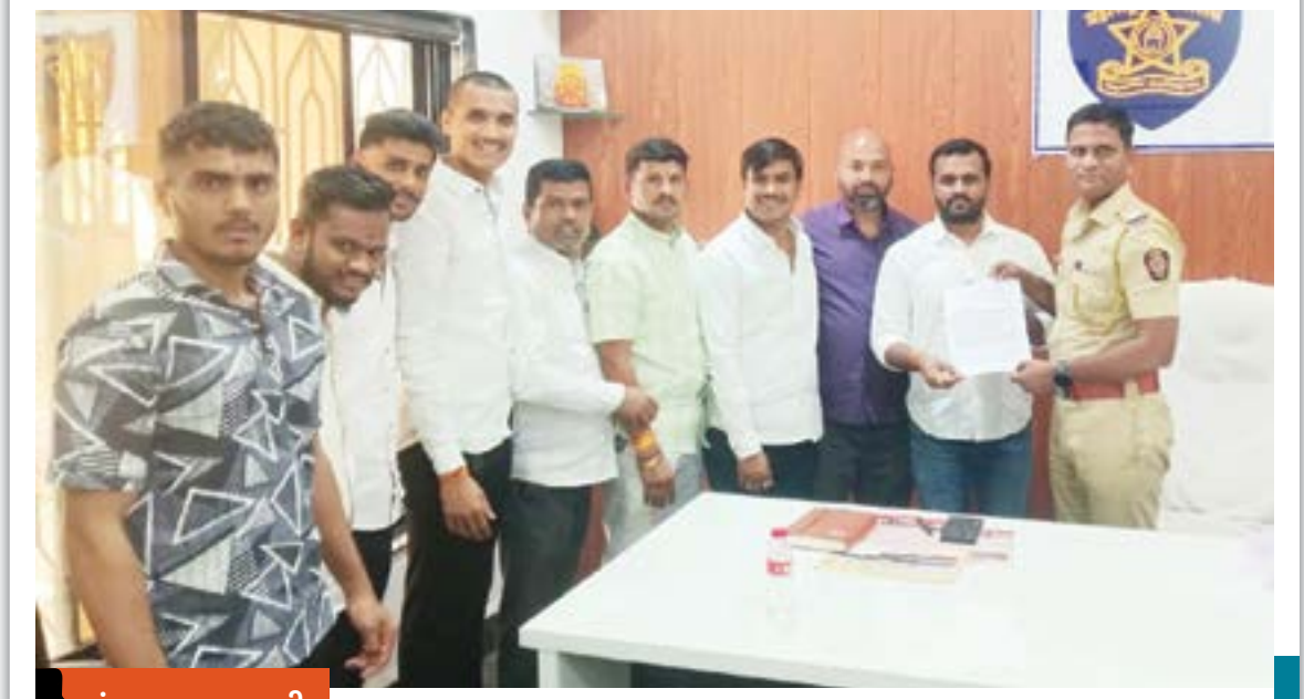
रांजणगाव गणपती रांजणगाव एमआयडीसी पोलीस स्टेशनला निवेदन देताना बजरंग दलाचे पदाधिकारी.