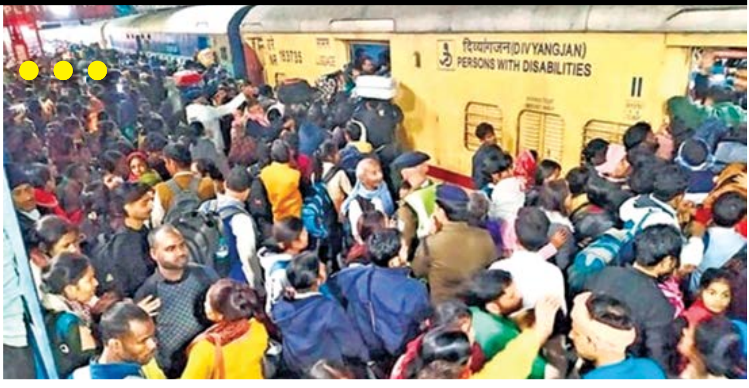
■ नवी दिल्ली अनास्थेचे बळी: कुंभमेळ्याला जाणारी रेल्वे प्लॅटफॉर्म क्रमांक १४ वर होती. यावेळी तिथे आधीच मोठी गर्दी होती आणि इतर प्रवासीही तिथे पोहोचण्याचा प्रयत्न करत होते. रेल्वेचे अचानक प्लॅटफॉर्म क्रमांक १६ वरून विशेष ट्रेनची घोषणा केली. त्यामुळे गोंधळ उडाला. गर्दी नियंत्रणाबाहेर गेली आणि लोक एकमेकांवर पडून जखमी झाले.

● चौकशी समितीची स्थापना ● दोन गाड्या रद्द झाल्यामुळे दुर्दैवी घटना