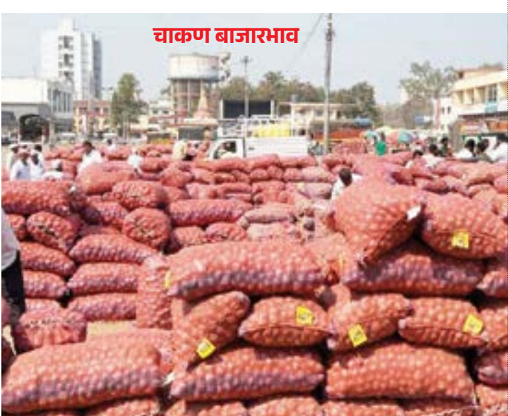
चाकण बाजारात कांद्याची झालेली आवक. ( छाया - अविनाश दुधवडे, चाकण )

रुपयांवरून ३ हजार रुपयांवर पोहोचला. बटाट्याची एकूण आवक १,५०० क्विंटल झाली. गेल्या आठवड्याच्या तुलनेत ही आवक १ हजार क्विंटलने घटूनही कमाळ भाव २,००० रुपयांवर स्थिर राहिले. लसणाची एकूण आवक २५ क्विंटल झाली. गेल्या आठवड्याच्या तुलनेत ही आवक १५ क्विंटलने वाढून भावात ८ हजार रुपयांची घट झाली. लसणाचा कमाळ भाव २५,००० रुपयांवरून १७ हजार रुपयांवर स्थिरावला. हिरव्या मिरचीची एकूण आवक ३२ क्विंटल झाली. हिरव्या मिरचीला ३ हजार रुपयांपर्यंत ते ५ हजार रुपयांपर्यंत भाव मिळाला. ओल्या भुईमूग शेंगांची एकूण आवक ३ क्विंटल झाली असून, या शेंगांना ८ हजार रुपयांपर्यंत कमाळ भाव मिळाला.