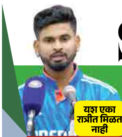
यश एका राष्ट्रीय मिळत नाही

“मी यशच्या मागे धावत नाही. मी दैनंदिन दिनचर्या पाळतो, ज्यामुळे मला यश मिळेल. माझ्यासाठी, चॅम्पियन मी आहे. मला वाटते की हे सर्व तुमच्या मनात आहे. मला वैयक्तिकरित्या असे वाटते की तुमच्याशिवाय तुम्हाला साथ देणारे कोणी नाही.” “मी नेहमी म्हणतो की तुम्ही वर्तमानात जगले पाहिजे. मी भाग्यवान आहे की मी २०४ मध्ये इतक्या चॅम्पियनशिप जिंकल्या आहेत. मी दरोडा घेत असलेल्या मेहनतीच परिणाम मला नक्कीच मिळणार. एकूणच हा