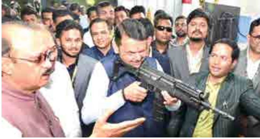
पुणे न्याय आणि सुरक्षेसाठी अढळ निधारी! - निबे लिमिटेड' वर्धापन दिन व अत्याधुनिक क्षेपणास्त्र संकुल, लघु शस्त्रास्त्र निर्मिती सुविधेची पाहणी करताना...

अशा लोकांना मकोका लावा, काय वाटेल ते लावा, कुठलेही कलमे लावा परंतु शासन करा त्यांच्यावरती कठोर कारवाई करा असे ते म्हणाले. इतकेच नव्हे तर अशा गुन्हेगारांची धिंड काढून त्यांच्यावर जबर बसवा असेही आदेश पोलिसांना दिले.