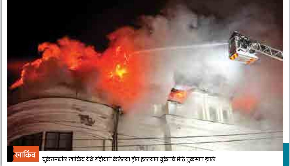
युक्रेनमधील खार्किव येथे रशियाने केलेल्या ड्रोन हल्ल्यात युक्रेनचे मोठे नुकसान झाले.