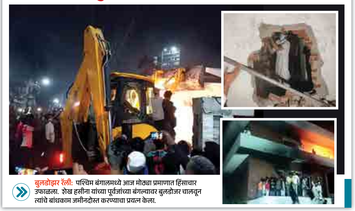
बुलडोझर रॅली: पश्चिम बंगालमध्ये आज मोठ्या प्रमाणात हिंसाचार उफाळला. शेख हसीना यांच्या पूर्वजांच्या बंगल्यावर बुलडोझर चालवून त्यांचे बांधकाम जमीनदोस्त करण्याचा प्रयत्न केला.