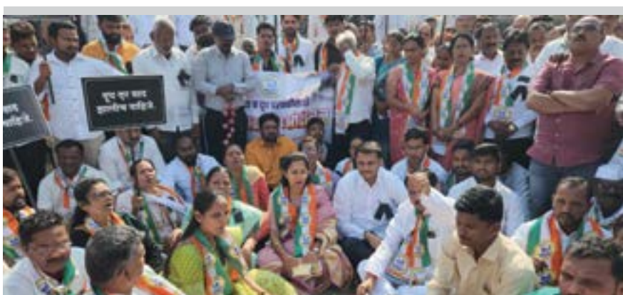
सुणे बारामती : कांधाला आणि दुधाला हमीभाव मिळावा या मागणीसाठी खासदार सुप्रिया सुळे रस्त्यावर उतरल्या. बारामतीतल्या तीन हत्ती चौकात खासदार सुप्रिया सुळे यांनी शेतकऱ्यांच्या प्रश्नासाठी ठिण्या मांडला.