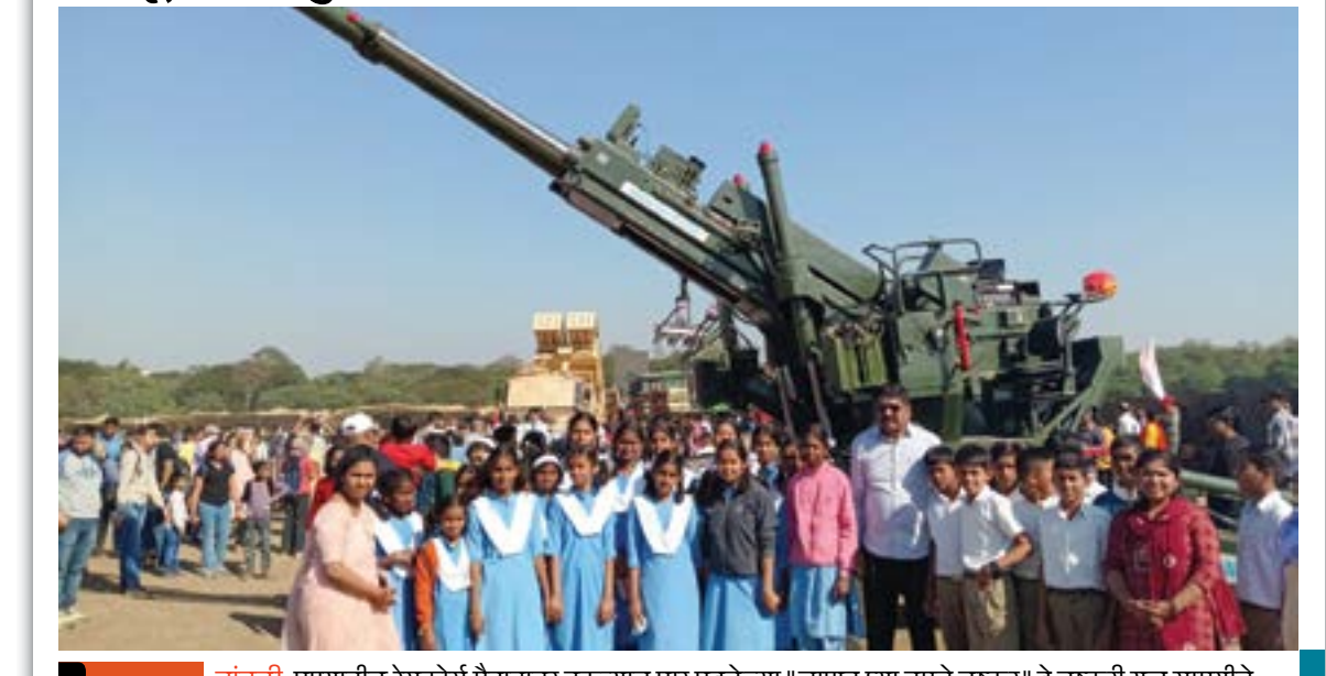
सासवड चांबळी: पुण्यातील रेसकोर्स मैदानावर नुकत्याच पार पडलेल्या "जाणून घ्या तुमचे लष्कर" हे लष्करी युद्ध सामग्रीचे प्रदर्शन पाहण्याची संधी चांबळी येथील कृषी औद्योगिक विद्यालयातील विद्यार्थ्यांनी अनुभवली.