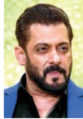
आली आहे. १४ एप्रिल रोजी सलमान खान याच्या गॅलेक्सी अपार्टमेंटच्या इथे

मुंबई : अभिनेता सलमान खानने त्याच्या निवास्थानाची सुरक्षा वाढवल्याचे दिसत आहे. सलमानने त्याच्या वांद्रे येथील गॅलेक्सी अपार्टमेंटच्या बाल्कनीमध्ये नवीन बुलेटप्रुफ काच बसली आहे.