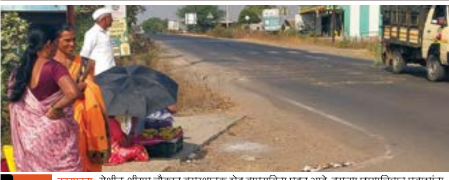
आंबेगाव कारफाटा: येथील श्रीराम चौकात बसस्थानक शेड वापराविना पडून आहे. दुसऱ्या छयाचित्रात प्रवाशांना निवारा नसल्याने त्यांचे हाल होत आहेत.

शेड उभारण्यात आलेली आहेत. श्रीराम चौकात देखील शेडसाठी जागा निश्चित करून तेथे सिमेंट कोंक्रीटकरण करण्यात आले आहे. परंतु तेथे अद्यापही शेड उभारण्यात आलेले नाही. जे पूर्वीचे शेड आहे, ते वापराविना आहे. त्यामुळे सध्या शाळकरी विद्यार्थी, प्रवासी, यांची मोठी गैरसोय होत आहे.