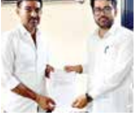
मोठ्या प्रमाणात समस्या आहेत. अनेक शेतकरी वेळेत ऊसतोडणीची मागणी करतात. मात्र, काही कारखान्यांकडून जाणीवपूर्वक ऊसतोड दिली जात नाही. त्यामुळे शेतकऱ्यांचे जाते नुकसान होते. हे नुकसान टाळण्यासाठी राज्याचे