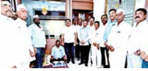
यांनी घालून दिलेली सहकारातील शिस्त आणि कामाच्या पद्धतीप्रमाणे संत सोपानकाका सहकारी बँक कार्यरत असल्याने व सभासद, ठेवीदार, कर्जदार, खातेदार या सर्वांच्या विश्वासामुळे