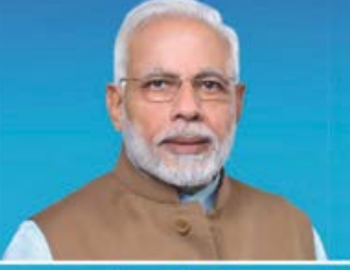
नरेंद्र मोदी पंतप्रधान