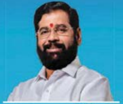
एकनाथ शिंदे मुख्यमंत्री, महाराष्ट्र राज्य