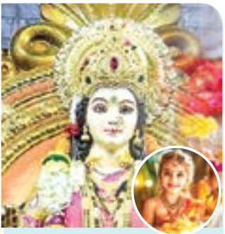
पाच हजारहून अधिक मुलींचे पूजन