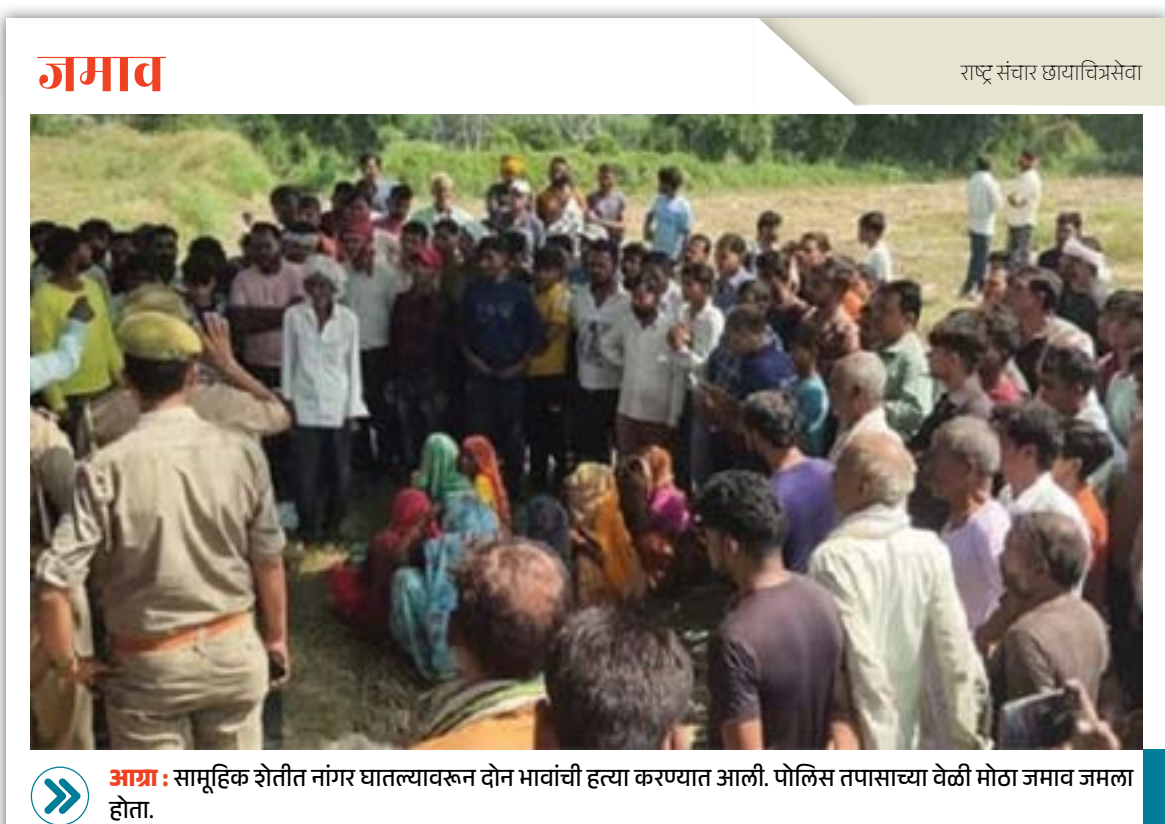
जमाव : सामूहिक शेतीत नांगर घातल्यावरून दोन भावांची हत्या करण्यात आली. पोलिस तपासाच्या वेळी मोठा जमाव जमला होता.

भ्रष्टाचाराच्या आरोपावरून वाद झाला होता. यानंतर दोघांचे समर्थक एकमेकांना भिडले. सभेत उपस्थित सुरक्षा दलांनी दोन्ही बाजूंना शांत करण्याचा प्रयत्न केला; मात्र ते कोणाचेही ऐकायला तयार नव्हते. बराच वेळ हा गोंधळ सुरू होता. अखेर त्यांना शांत करण्यात ते यशस्वी झाले. विधानसभा अध्यक्ष सभागृहातून बाहेर पडताच गोंधळ आणि हाणामारी झाली.