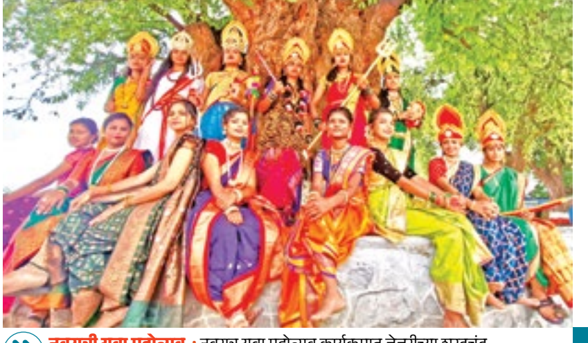
नवरात्री युवा महोत्सव : नवरात्र युवा महोत्सव कार्यक्रमात जेजुरीच्या शरदचंद्र महाविद्यालयात विद्यार्थ्यांनी नव दुर्गा रूपे साकारून उपस्थितांची मने जिंकली