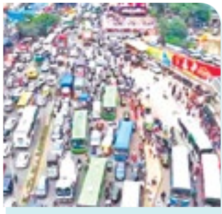
काग्रज- कोढवा वाहतूक कोंडी फोडण्यासाठी उपाययोजनांची गरज