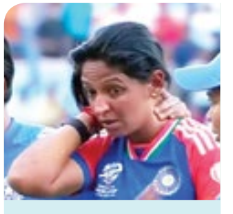
पाकिस्तानविरुद्ध विजय, पण कर्णधार कौरला दुखापत