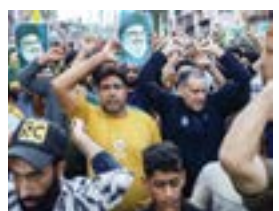
पोलिसांनी सातखंडाजवळ थांबवली. शिया धर्मगुरू मौलाना

ते मोठ्या इमामबाड्यापर्यंत लोकांनी इसायल विरोधी आणि अमेरिकेविरोधी घोषणा दिल्या. मेणबत्त्या आणि मोबाईल टॉर्चच्या प्रकाशात हजारो पुरुष, महिला आणि मुलांनी मिरवणूक काढली. सायंकाळी उशीरा छोट्या इमामबाड्यापासून निघालेली मिरवणूक काही अंतर पुढे जाताच