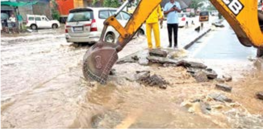
अतिक्रमण पुन्हा एकदा चव्हाट्यावर: चाकण औद्योगिक भागात ओढ्यांवर झालेल्या अतिक्रमणांमुळे निर्माण होणारी स्थिती.

यंदा पावसाने ठिकठिकाणी घरे, दुकाने आणि महामार्गावर पाणी तुंबले. सर्वत्र ओढ्यांवर झालेले अतिक्रमण पुन्हा एकदा चव्हाट्यावर आले आहे. चाकण