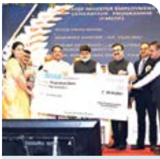
'महाराष्ट्राची उद्योग भरारी' ला उद्योगाचा प्रतिसाद