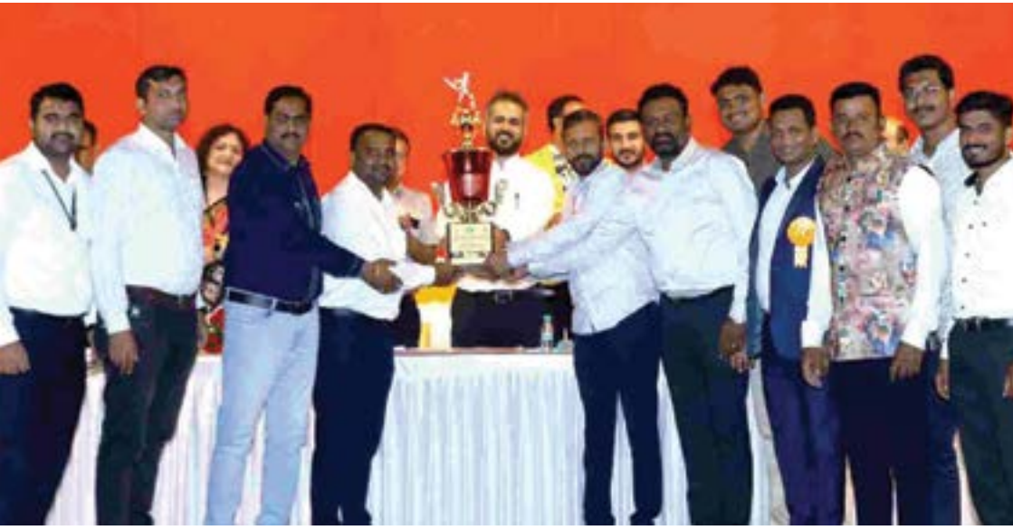
पिंपरी : पिंपरी चिंचवड महापालिका आणि पिंपरी चिंचवड ज्युनियर इंजिनियर्स असोसिएशन यांच्या वतीने चिंचवड येथील प्रा. रामकृष्ण मोरे नाट्यगृह येथे भारततरल मोक्षगुंडम विश्वेश्वरैया यांच्या जयंतीनिमित्त राष्ट्रीय अभियंता दिन साजरा करण्यात आला.