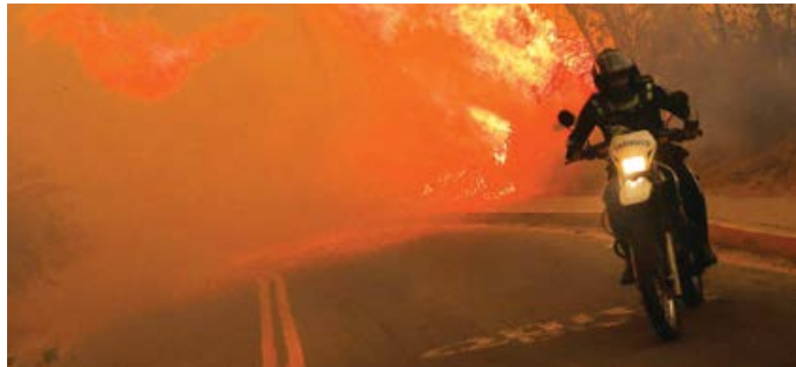
राष्ट्र संचार छायाचित्रसेवा

क्वितो : इक्वाडोरमध्ये वणव्यात आग लागल्यावर एक चालक मोटारसायकल घेऊन त्यातून मार्ग काढताना दिसून आला.