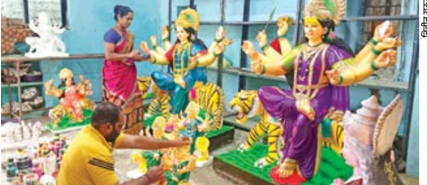
नवरात्र उत्सवाची सर्वत्र चाहूल सुरू असून या पार्श्वभूमीवर देवीच्या मूर्तीवर रंगकाम करताना मूर्तिकार.