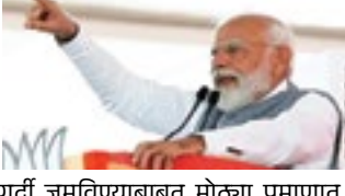
गर्दी जमविण्याबाबत मोठ्या प्रमाणात चर्चा झाल्याची माहिती आहे. महात्मा फुले आणि क्रांतीज्योती सावित्रीबाई फुले यांनी मुलींची पहिली शाळा सुरू केलेल्या शिवाजी रस्त्यावरील ऐतिहासिक भिडे वाड्याचे राष्ट्रीय स्मारक कामाचे भूमिपूजन पंतप्रधान नरेंद्र मोदी यांच्या हस्ते होणार आहे. >> पान ७ वर

पुणे : पंतप्रधान नरेंद्र मोदी आज पुणे दौऱ्यावर येत आहेत. या दौऱ्यामध्ये मोदींच्या हस्ते विविध विकास कामांचे भूमिपूजन आणि उद्घाटन करण्यात येणार आहे. एसपी कॉलेजच्या ग्राऊंडवर त्यांची सभा होणार आहे. या सभेसाठी मोठी तयारी करण्यात आली आहे. विधानसभा निवडणुकीच्या पार्श्वभूमीवर होणाऱ्या या दौऱ्यासाठी भाजप नेते जोरदार कामाला लागले आहे. नुकतेच या दौऱ्याच्या निमित्ताने नियोजनासाठी बैठक झाली. बैठकीत