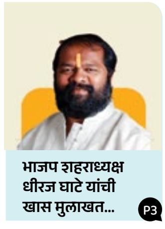
भाजप शहराध्यक्ष धीरज घाटे यांची खास मुलाखत...