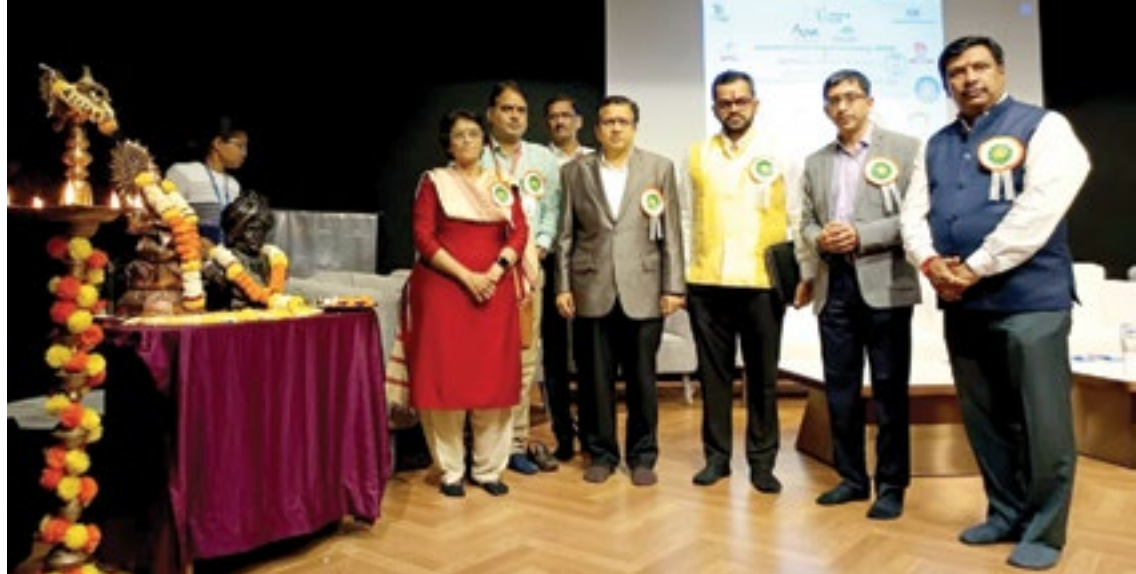
पिंपरी : राष्ट्रीय सेवा योजना व आईटी विभागाच्या वतीने सीआयआय यंग इंडियन्सच्या सहकार्याने व्यसनमुक्ती या विषयावर युवकांशी संवादा कार्यक्रमाचे आयोजन करण्यात आले होते.