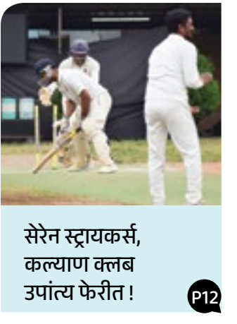
सेरेन स्ट्रायकर्स, कल्याण क्लब उपांत्य फेरीत !