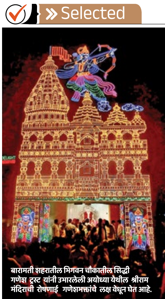
बारामती शहरातील भिगवन चौकातील सिद्धी गणेश ट्रस्ट यांनी उभारलेली अयोध्या येथील श्रीराम मंदिराची रोषणाई गणेशभक्तांचे लक्ष वेधून घेत आहे.