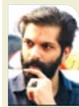
त्यांच्यासमोर हा प्रश्न मांडणार आहोत.

वसतिगृहातील दोन विद्यार्थ्यांचा मृत्यू होतो कसा?