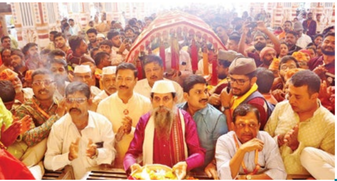
पिंपरी : श्रीमंत दगडूशेट हलवाई सार्वजनिक गणपती ट्रस्ट, सुवर्णयुग तरुण मंडळा तर्फे उत्सवाच्या १३२ व्या वर्षी चिंचवड देवस्थान ट्रस्ट तर्फे आलेल्या पालखीचे स्वागत करण्यात आले.