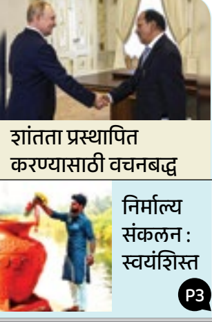
शांतता प्रस्थापित करण्यासाठी वचनबद्ध