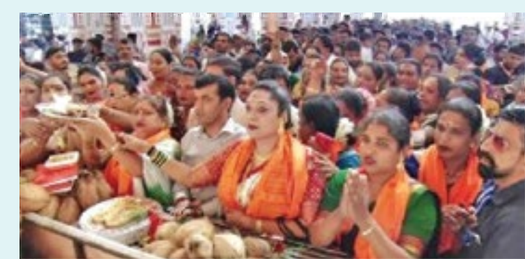
सार्वजनिक गणपती ट्रस्ट, सुवर्णयुग मंगलमुखी किन्नर चॅरिटेबल ट्रस्ट मधील तरुण मंडळ तर्फे १३२ व्या वर्षी आयोजित गणेशोत्सवात गणेश पेठेतील

पुणे : सामान्य स्त्री-पुरुषांप्रमाणेच समाजातील महत्त्वाचा मात्र बाजूला असलेला घटक म्हणजे तृतीयपंथी. गणपती बाप्पाच्या भेटीची ओढ जशी सामान्य भक्ताला असते, तशी या तृतीयपंथीच्या मनातील बाप्पाच्या भेटीची ओढ आज दगडूशेठ गणपतीसमोर पहायला मिळाली. विविधांगी अलंकारांनी सजून आपल्या पारंपरिक वेशभूषेत तृतीयपंथीयांनी दगडूशेठ गणपतीचे मनोभावे दर्शन घेत आरतीही केली.