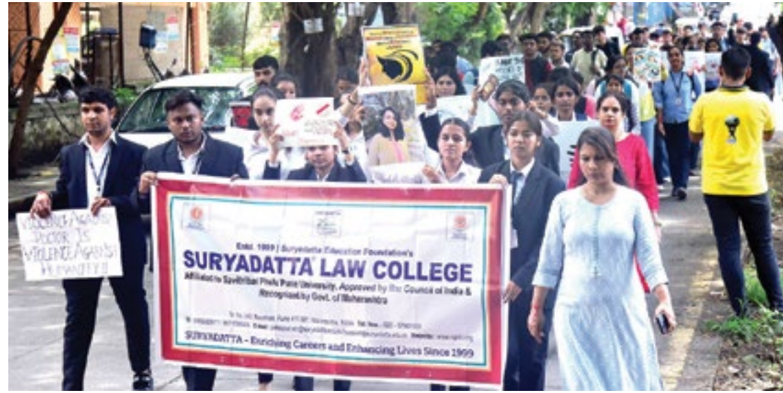
पुणे : महिलांवर अन्याय करणाऱ्या नराधमांना कठोर शासन करावे, या मागणीसाठी, महिलांवरील अन्यायाविरोधात जागृती करण्यासाठी सूर्यदत्त विधी महाविद्यालयाच्या (एसएलसी) वतीने बावधन परिसरात शांतता मोर्चा काढण्यात आला.