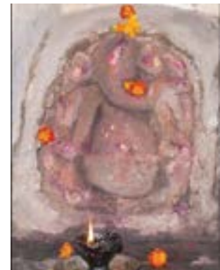
गड गणेश सुरेश तरलगुडी शिवसुर्य प्रतिष्ठान पुणे

स्वातंत्र्यपूर्वकालापर्यंत भोर संस्थानातील हा किल्ला व्यवस्थित पणे राखला जात होता. व आजही दुर्ग संवर्धन करणाऱ्या संस्थांकडून सुस्थितीत राखण्याचा