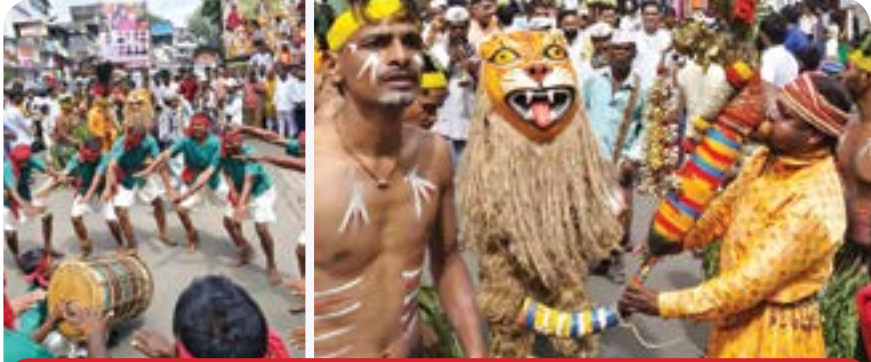
आदिवासींचे पारंपरिक नृत्य आणि संगीताने गणेशभक्त तल्लीन

पुणे : लोकनृत्य हा आपल्या संस्कृतीचा एक भाग आहे, जो कोणत्याही समाजाची विविध रूपे दाखवतो, यातून समाजातील परंपरा समजून घेता येतात. अशात धनकवडीतील ११ गणेश मंडळांच्या संयुक्त मिरवणुकीची चर्चा पुणे सहित संपूर्ण जगभर पोहचली आहे. 'आदिवासी युनिव्हर्सल टॅबल' या संस्थेकडून शहरात प्रथमच गणेश आगमनाच्या वेळी आदिवासी संस्कृतीची झलक पहावयास मिळाली. यात आदिवासी नृत्य आणि संगीताला समर्पित करण्यात आली. यांच्या पारंपारिक नृत्य आणि संगीताने गणेश भक्तांना मंत्रमुग्ध केले.