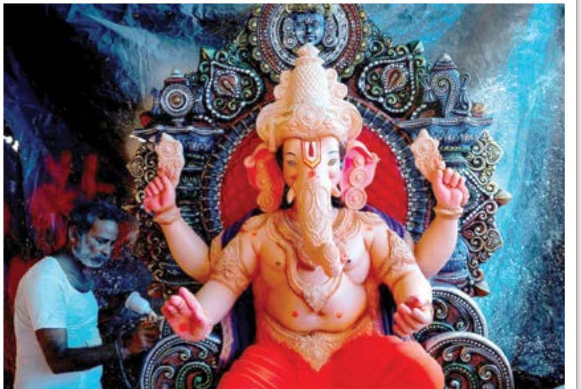
अहमदाबाद : श्री गणेश उत्सवाच्या पूर्वसंध्येला श्रींच्या मूर्तीवर अखेरचा हात फिरवण्यात मग्न असलेला शिल्पकार.