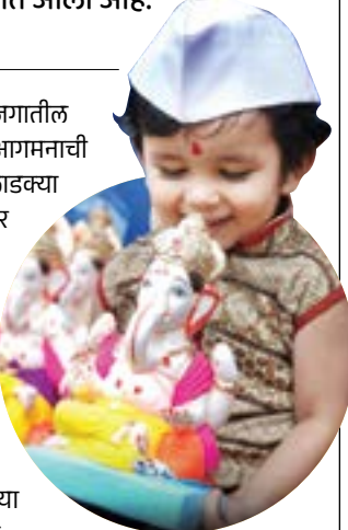
गणपती बाप्पा मोरया मंगलमूर्ती मोरया

पुणे: महाराष्ट्रातील नव्हे तर जगातील प्रत्येक माणसाला बाप्पाच्या आगमनाची आस लागलेली असते. आज लाडक्या बाप्पाचे आगमन शुभ मुहूर्तावर होत आहे. हिंदू पंचांगानुसार गणेश चतुर्थी दरवर्षी भाद्रपद महिन्यातील शुक्ल पक्षातील चतुर्थी तिथीला साजरी केली जाते. यंदा ही तिथी आज ७ सप्टेंबर २०२४ ला. तर १७ सप्टेंबरला अनंत चतुर्दशी असणार आहे. या काळात ज्येष्ठा गौरी आवाहान, पूजन आणि गौरी विसर्जनही केले जाईल. पाच दिवसांच्या गणपती १२ सप्टेंबरला विसर्जन केले जाईल. पंचांगानुसार गणेश चतुर्थीचा शुभ मुहूर्त हा ३१ मिनिटांचा असणार आहे. परंतु हा संपूर्ण दिवस चांगला असल्याने गणेश स्थापना कधीही करता येऊ शकते. गणेश चतुर्थी ही शनिवारी ७ सप्टेंबरला दुपारी ३ वाजून १ मिनिटांनी सुरू होईल.