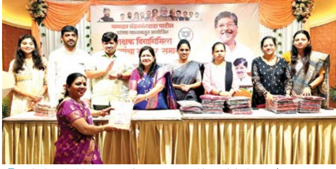
पुणे: शिक्षक दिनानिमित्त ना. चंद्रकांत पाटील यांच्या माध्यमातून पालिकेच्या शाळेतील शिक्षकांचा गौरव करण्यात आला.