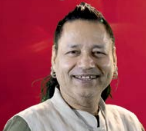
पद्मश्री कैलाश खैर सुप्रसिद्ध गायक, संगीतकार

शनिवार, दि. ७ सप्टेंबर २०२४, दुपारी १२:३० वा.