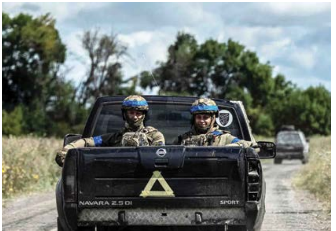
सुमी प्रदेश : युक्रेनने रशियाच्या प्रदेशात घुसखोरी करण्यात यश मिळवले. त्यामुळे हजारो रशियन नागरिकांनी स्थलांतर केले. युक्रेनी सैनिक रशियन सीमेजवळ वाहन चालवताना टिपलेले छायाचित्र.