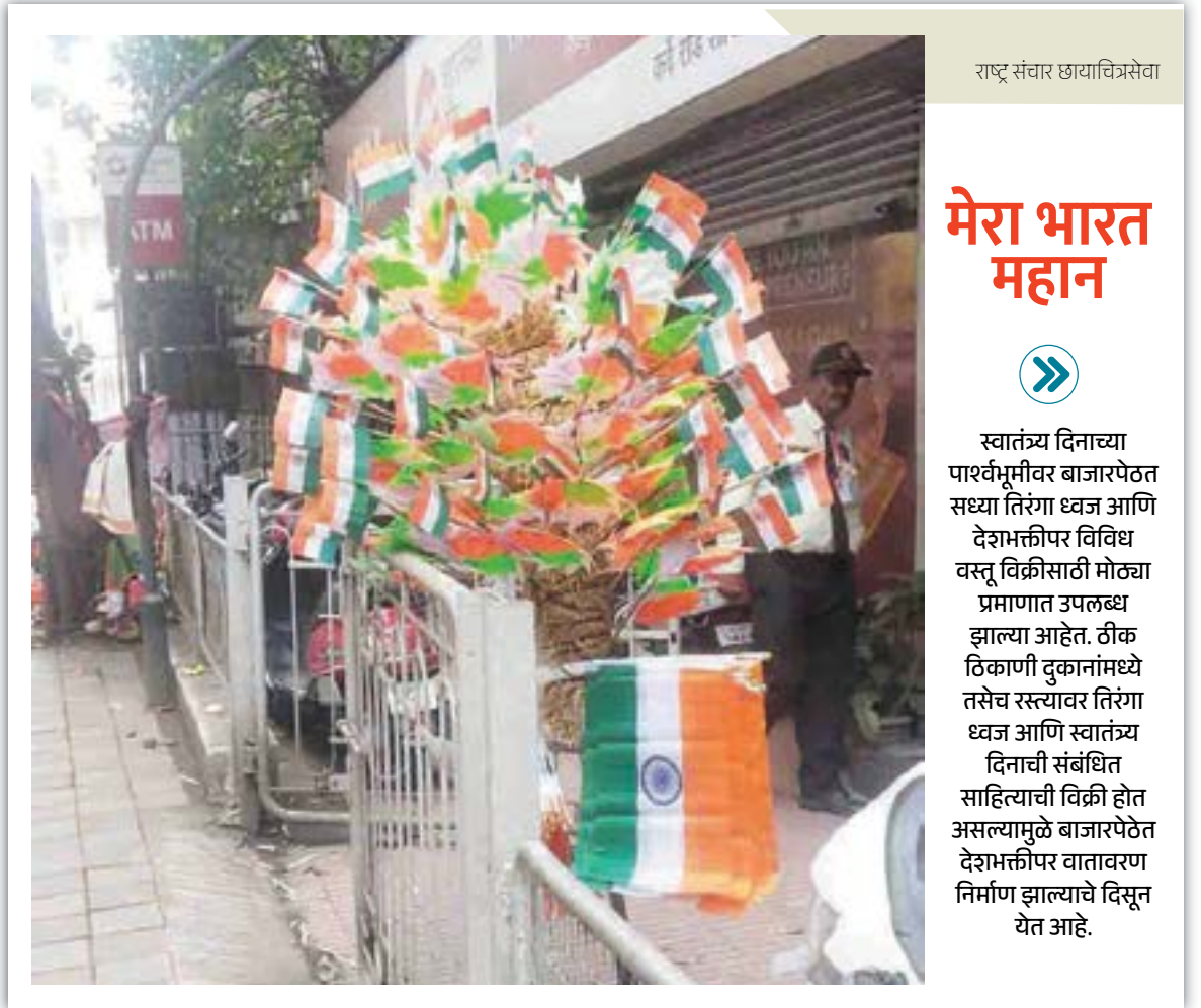
राष्ट्र संचार छायाचित्रसेवा

● "लोकसभा निवडणुकीत आलेल्या अपयशानंतर महायुतीला लाडक्या बहिणीची आठवण झाली. मात्र, तोपर्यंत फक्त फुटलेले लाडके आमदार आणि फुटलेले लाडके खासदार या पलिकडे यांचं लाडकं कोणीही नव्हतं. एका-एका आमदाराला ५०-५० कोटी आणि एका-एका खासदाराला १०० कोटी देण्यात आले. ठाकरे गटाचे पदाधिकारी फोडण्यासाठी आताही कोट्यवधी रुपये खर्च होत आहेत. पण लाडक्या बहिणीसाठी १५०० रुपये देण्यात येत आहेत. यावरही चर्चा होईल. निवडणुकीनंतर नोव्हेंबरमध्ये राज्यात सत्तातर झालेलं दिसेल.