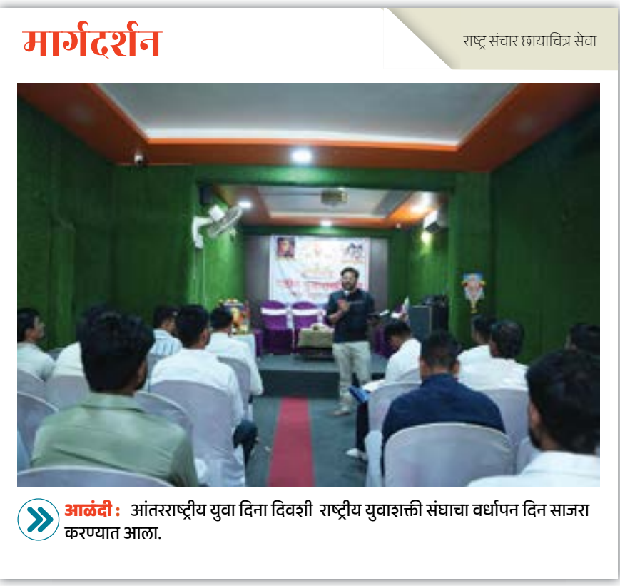
आळंदी : आंतरराष्ट्रीय युवा दिना दिवशी राष्ट्रीय युवाशक्ती संघाचा वर्धापन दिन साजरा करण्यात आला.

करेल. सामाजिक काम करत असताना युवकांचे योग्य शिक्षण, शिक्षण झालेल्या युवकांना योग्य ठिकाणी कामाला लावून परमनंत करणे, व्यवसायासंदर्भात मार्गदर्शन करणे, युवकांच्या प्रगतीसाठी वेळोवेळी आवाज उठवणे या कामावरती संघातील पदाधिकाऱ्यांनी लक्ष देण्यात यावे. राष्ट्रीय युवा शक्ती संघ हा आचार्य चाणक्य आणि भगतसिंग, राजगुरू, सुखदेव यांची प्रेरणा घेऊन चालत आहे. संघ हा सदैव युवकांच्या प्रगतीसाठी आवाज उठवेल आणि देशांमध्ये एकता, बंधुता आणि समानता शांततेच्या मार्गाने प्रस्थापित राहण्यासाठी काम करेल. यासाठी प्रत्येकाने आपापल्या प्रांतामध्ये लक्ष देऊन काम केले पाहिजे असे सांगितले.