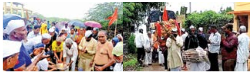
निमगाव म्हाळुंगी ता. शिरूर येथून ग्रामदैवताची भीमास्नान साठी निघालेली पालखी.