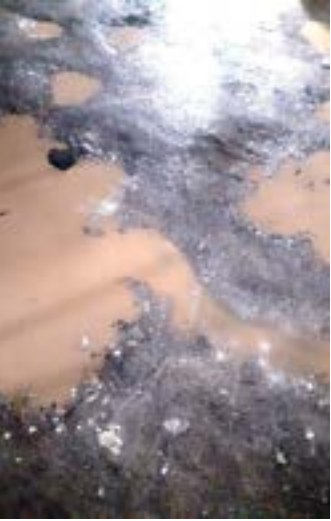
जागेतून वाहने हाकताना दिसून येते. शहर आणि उपनगरात मोठ्या प्रमाणात अतिक्रमणे झाली आहेत. ही अतिक्रमणे मुळात काल परवा झालेले नाही.

पुणे : मागील ८ ते १० दिवसांपासून सुरू असलेल्या दमदार पावसामुळे पुण्यातील रस्त्यांवर खड्डे पडले आहेत. त्यावरून केंद्रीय राज्यमंत्री मुरलीधर मोहोळ यांनी प्रशासनाला चांगलेच सुनावले. त्यानंतर रस्त्यावरील खड्डे बुजवायला प्रशासनाने लक्ष घातले आहे.