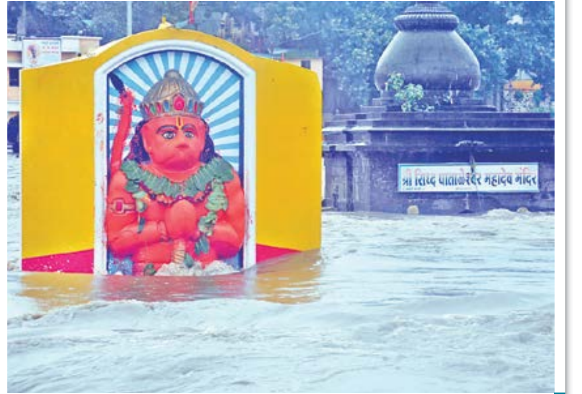
नाशिक : गंगापूर धरणातून सुरु असलेल्या विसर्गामुळे गोदावरी नदीला आलेला पूर.