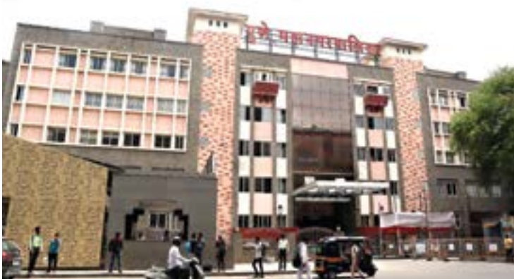
धायरी (उर्वरित), उंड्री, आंबेगाव खुर्द आणि आंबेगाव बुद्रुक यांचा समावेश आहे. समाविष्ट गावांत २४ तास स्वच्छ पाणीपुरवठा करण्याची मागणी करण्यात येत आहे. कचरा नियमितपणे उचलण्यात यावा. ज्या प्रकारे टॅक्स करण्यात येतो.

पुणे : महापालिकेत समाविष्ट झालेल्या गावांत गार्डन, हॉस्पिटल, नाट्यगृह, मंडई, मैदानांची वणवा आहे. आपल्या जागेवर वरील आरक्षण टाकण्याच्या आधीच मोठ्या प्रमाणात बांधकामे करण्यात येत आहे. आणि स्वस्त किमतीत घर म्हणून विक्री केली जात आहेत. नागरिक सुध्दा स्वस्तात महापालिका हद्दीत घर उलब्ध असल्याने खरेदी करीत आहे.