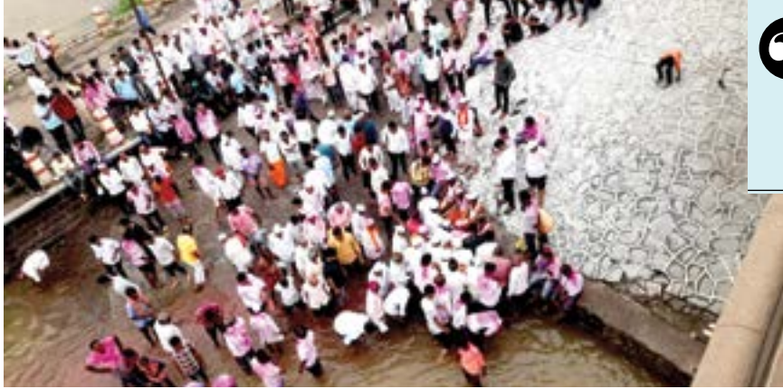
गुळुचे येथील श्री ज्योतिर्लिंग व श्री ज्योतिबा देवाच्या उत्सवमुर्तींनी नीरा नदीच्या पात्रात स्नान घातले.

नीरा : पुरंदर तालुक्यातील गुळुचे येथील काटेबारस यात्रेसाठी प्रसिद्ध असलेल्या श्री ज्योतिर्लिंग व श्री ज्योतिबा देवाच्या उत्सव मुर्तींना श्रावणा निमित्त नीरा नदीच्या पवित्र तीर्थात स्नान घालण्यात आले. तिर्थक्षेत्राचा 'ब' दर्जा असलेल्या गुळुचे येथील ज्योतिर्लिंग मंदिरात श्रावण महिन्यातील सोमवार सह इतर दिवशी शिवपींडीवर अभिषेक करण्याची परंपरा आहे.