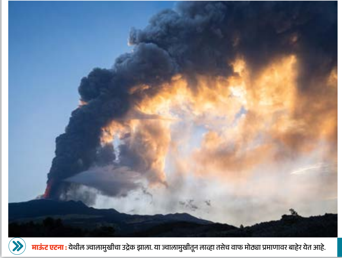
माऊंट एटना : येथील ज्वालामुखीचा उद्रेक झाला. या ज्वालामुखीतून लाव्हा तसेच वाफ मोठ्या प्रमाणावर बाहेर येत आहे.