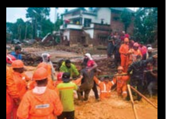
२५० जणांना सुरक्षित ठिकाणी हलवण्यात आले

नवी दिल्ली : केरळमधील वायनाड येथे भूस्खलनात ७० हून अधिक जणांचा मृत्यू झाला असून, बाधितांच्या बचाव आणि पुनर्वसनासाठी केंद्रसरकारने सर्वतोपरी मदत करावी, अशी मागणी विरोधी पक्षनेते राहुल गांधी यांनी मंगळवारी लोकसभेत केली. शून्य प्रहरात हा मुद्दा उपस्थित करत राहुल गांधी यांनी भूस्खलनात मृत्युमुखी पडलेल्यांच्या नातेवाईकांना वाढीव नुकसान भरपाई देण्याची तसेच वाहतूक आणि दळणवळण यंत्रणा पूर्ववत करण्याची मागणी केली. संसदीय कामकाज मंत्री किरेन रिजिजू म्हणाले की, पंतप्रधान नरेंद्र मोदी यांनी केरळचे मुख्यमंत्री पिनराई विजयन यांच्याशी चर्चा केली आहे.