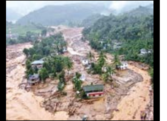
आणि होत्याचे झाले नव्हते...