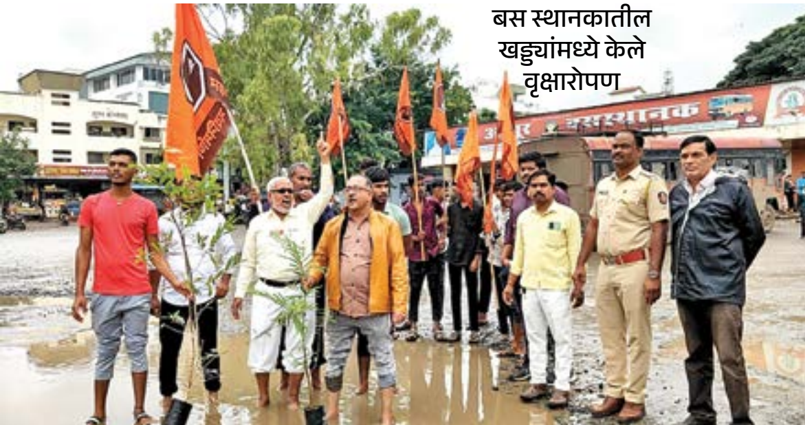
बस स्थानकातील खड्ड्यांमध्ये केले वृक्षारोपण

ओतूर : (ता.जुन्नर)येथील बसस्थानकात मोठमोठे खड्डे पडले असून या खड्ड्यात पाणी साचून येथे डबकी वजा डोह तयार झालेत.येथून ये जा करणाऱ्यांना याचा मोठ्या प्रमाणावर त्रास होत असल्याने जुन्नर तालुका म.न.से. ने येथे रविवारी(दि.२८) वृक्षारोपण करून खळखळ्याक आंदोलन केले तर हे खड्डे तात्काळ न बुजवल्यास या ठिकाणी खड्ड्यातच उपोषणाला बसणार असल्याचा इशारा देखील म.न.से.च्या वतीने देण्यात आला.