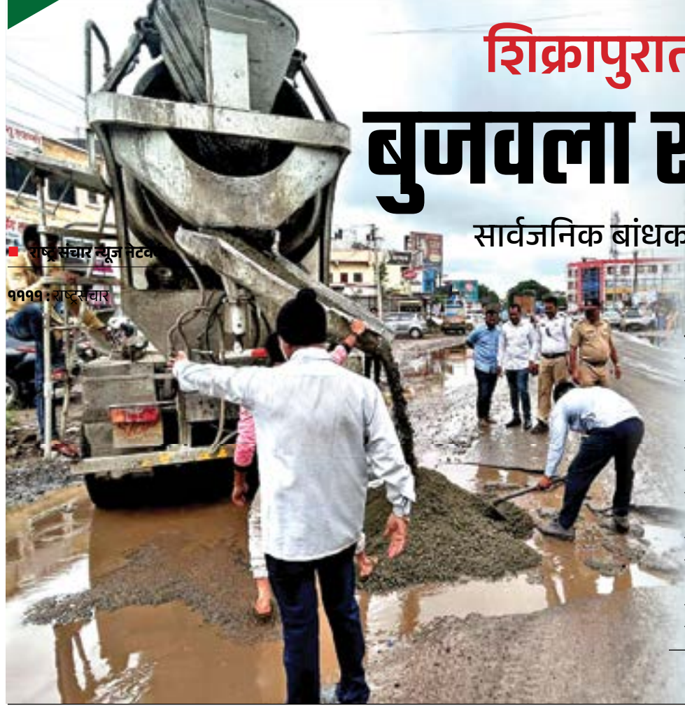
राष्ट्रसंचार न्यूज नेटवर्क १११११ : राष्ट्रसंचार