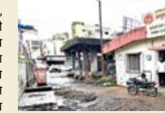
वतीने स्वच्छतेसाठी याठिकाणी दुर्लक्ष करण्यात येत आहे.सदरील ठिकाणी विजेचा ट्रान्सफॉर्मर देखील आहे त्याच्या आजूबाजूच्या संरक्षण झाल्या देखील तोडमोड झाली आहे. त्यांचे देखील कामकाज होणे गरजेचे

परिसराचीच अशी अवस्था आहे की, तिथे नागरिकांनी उपचार घ्यायचे की आरोग्य धोक्यात घालायचे हा प्रश्न उपस्थित राहिला आहे. उपकेंद्राच्या बाजूचेच चेंबर भरले असल्याने ड्रेनेजेचे पाणी पुढे जात नसल्याने त्या ठिकाणी मच्छरांचा प्रादुर्भाव होण्याची शक्यता आहे.पावसाच्या पाण्याने संपूर्ण ड्रेनेजेची घाण वाहून आली आहे व ती आरोग्य उपकेंद्राच्या परिसरातच साचली आहे.या ठिकाणी महापालिकेच्या वतीने देखील दुर्लक्ष केले जात आहे.महापालिकेच्या