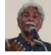
पुणे : युवक क्रांती दल, भारत जोडो अभियान, संविधान प्रचारक