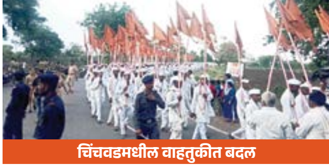
चिंचवडमधील वाहतूकीत बदल