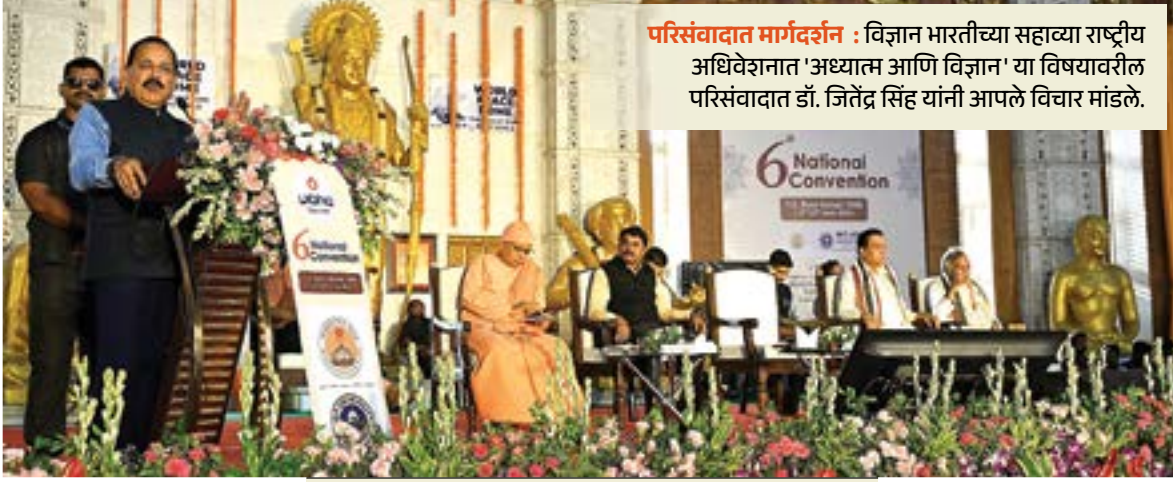
परिसंवादात मार्गदर्शन : विज्ञान भारतीच्या सहाव्या राष्ट्रीय अधिवेशनात 'अध्यात्म आणि विज्ञान' या विषयावरील परिसंवादात डॉ. जितेंद्र सिंह यांनी आपले विचार मांडले.