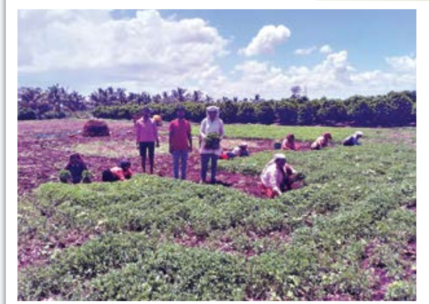
■ रंजणगाव गणपती : वाघाळे येथे मेथीच्या भाजीची उपटणी करताना महिला वर्ग.