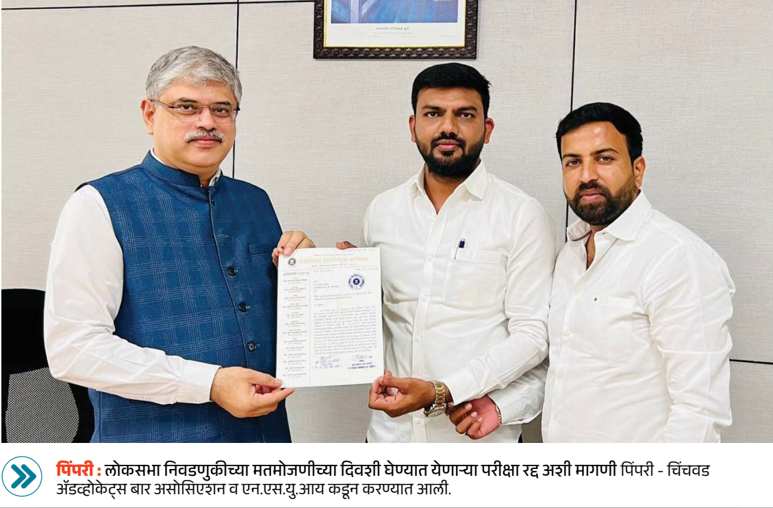
पिंपरी : लोकसभा निवडणुकीच्या मतमोजणीच्या दिवशी घेण्यात येणाऱ्या परीक्षा रद्द अशी मागणी पिंपरी - चिंचवड अॅडव्होकेट्स बार असोसिएशन व एन.एस.यु.आय कडून करण्यात आली.